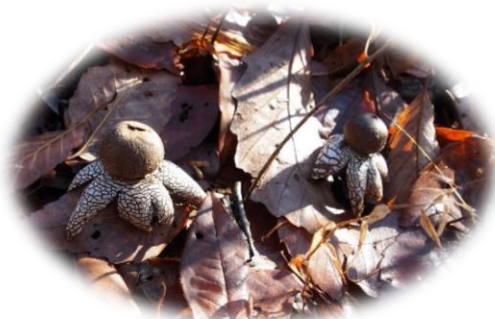
おもしろいキノコに出会えるかも？