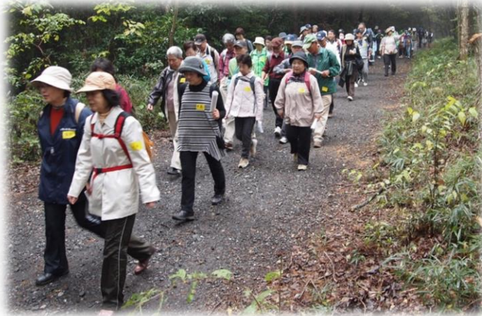
過去の環境ウォークの1シーン

主催：NPO 法人さやま環境市民ネットワーク 共催、後援、協力、協賛事業者名は裏面掲載