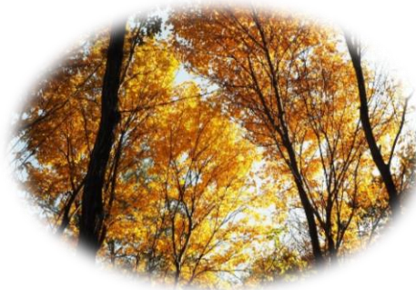
この時期、黄葉が最高