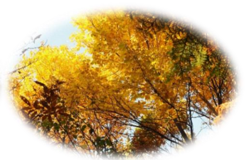
樹冠も黄葉で覆われる