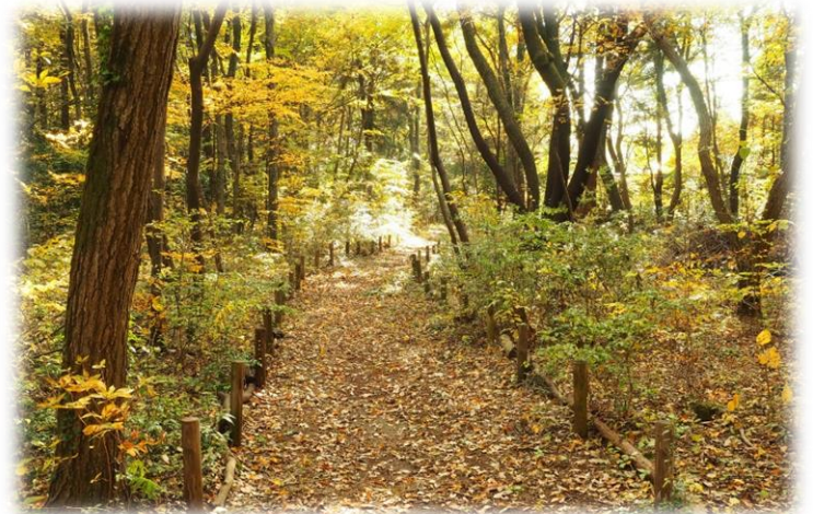
緑のトラスト狭山の散策路

主催：NPO 法人さやま環境市民ネットワーク 共催、後援、協力、協賛事業者名は裏面掲載